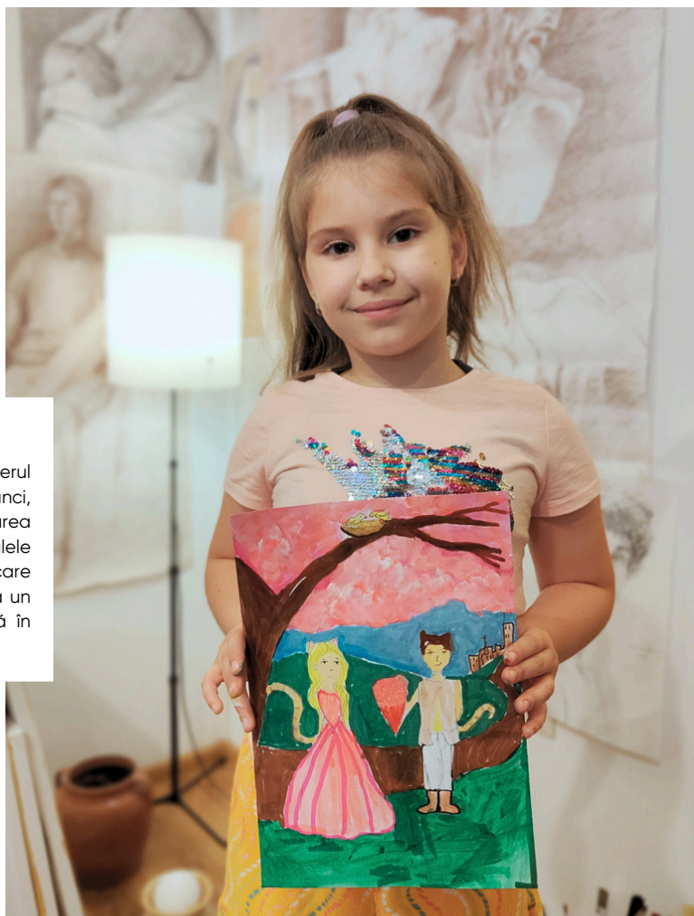
LUCRAREA PENTRU POVESTEA MARIEI | FOTO ÎN STUDIO

30 cm x 40 cm acrilă pe hârtie (2024) - Lucrarea originală nu este disponibilă. - Printul gresit de calitate a imaginii în dimensiunea de la 100 mm cu ramă simplă albă.